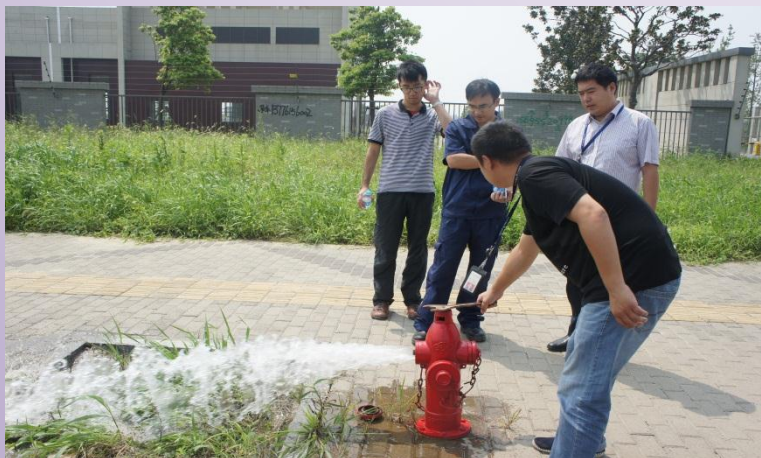
检查现场消防设施