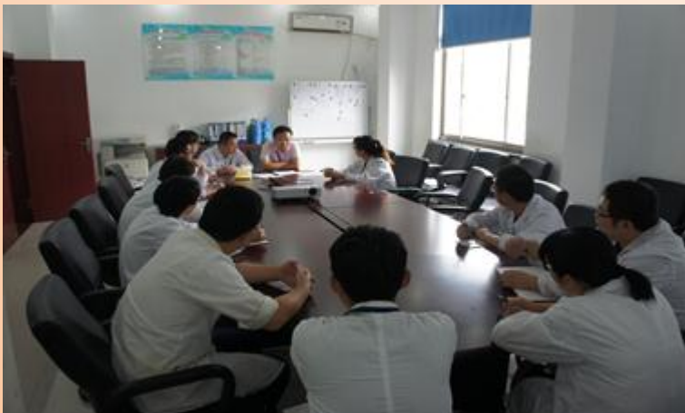
方案的布置与讨论

本次演练不仅检验了公司员工消防应急处置能力及火灾应急预案的可实施性，同时也是对检测中心全体员工进行了一次生动的消防安全培训，提高了其安全意识及火场应急处置能力。