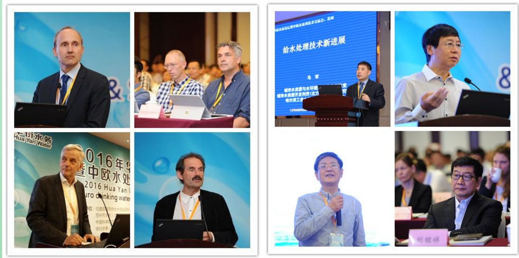
中、欧知名水处理专家做专题分享

本届论坛由住建部城市供水水质检测中心、江苏省城镇供水安全保障中心、苏州市水利（水务）局、《中国给水排水》杂志社、中国科学院饮用水科学与技术重点实验室、同济大学环境科学与工程学院、华衍水务（中国）有限公司联合主办，来自政府、国内外高校研究机构及水务公司等多个方面的逾300位嘉宾共同参与，就各国饮用水处理技术、净水新方法、水源至龙头全过程水质管理策略、输配水管网精细化管理、水厂制水净水优化、二次供水管理等饮用水安全保障领域内的热点问题，展开了深入的探讨和交流分享，共同探求饮用水水质管理水平的全面提升。