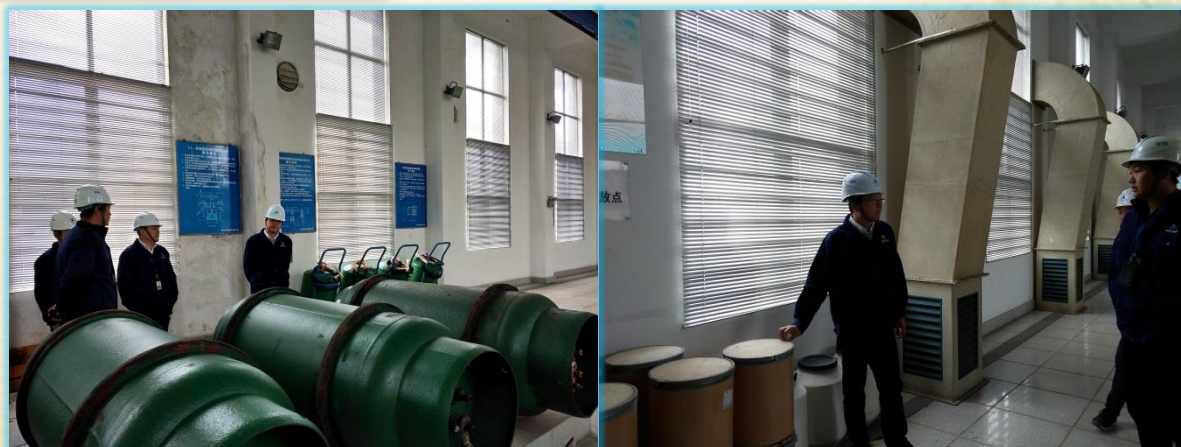
汤阳总经理在第二水厂加氯间检查