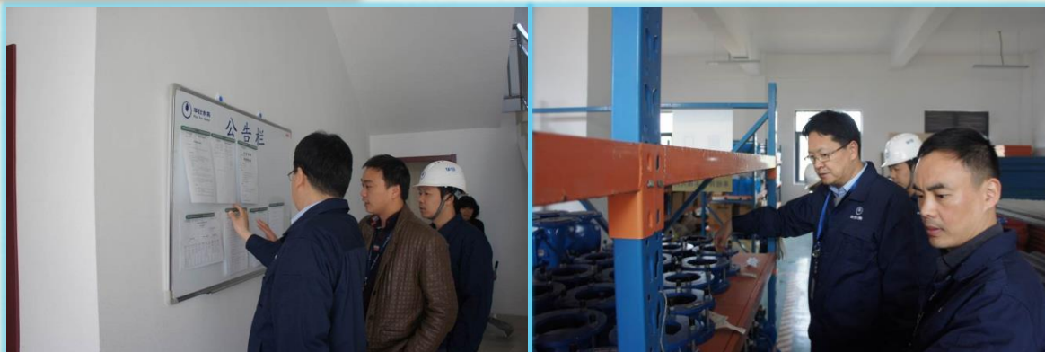
汤阳总经理在盛泽供水服务部办公楼及盛泽物料仓库检查